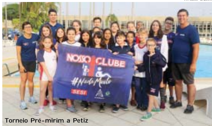
Torneio Pré-mirim a Petiz

O Departamento de Natação do Nosso Clube promoverá um bingo no dia 25 de outubro, a partir das 20 horas, no Salão Social. Com valor de R$ 40,00 cada, as cartelas podem ser adquiridas na secretaria do clube e com os diretores e professores da modalidade. O preço inclui, além do bingo, que terá prêmio de R$ 800,00 na cartela cheia e de R$ 200,00 na cinquena, cerveja, cerveja sem álcool, suco de laranja, refrigerante, água, churrasco, maionese e pão. Uma rodada extra, programada para as 20 horas, irá sortear uma bicicleta. Crianças a partir de 9 anos pagam a cartela.