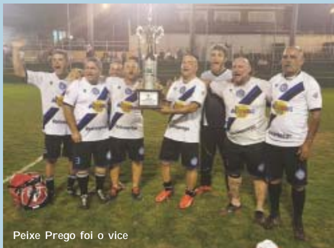
Peixe Prego foi o vice

A Dario Romeu Seguros venceu o Peixe Prego por 5 a 2 e ficou com o título do Campeonato de Futebol Super Máster 2019 do Nosso Clube. A decisão da competição, que reuniu associados nascidos até 1970, aconteceu no dia 12 de setembro. Na 1ª fase, todos os times se enfrentaram. Ao final dessa etapa, a Pedra da Ilha ficou em 1º. Assim, teve como adversário na semifinal a Dario Romeu, que terminou em 4º. Na outra semifinal, enfrentaram-se Peixe Prego (2º) e Unimed (3º).