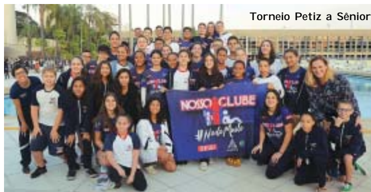
Torneio Petiz a Sênior